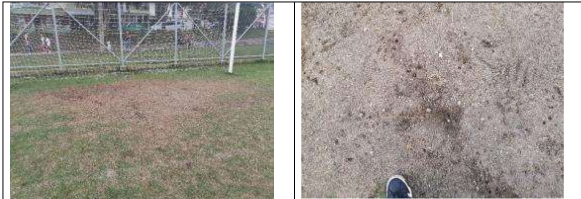
Foto No. 11 y 12: afectación de grama en zonas de arco, nótese la ausencia de grama instalada y el tamaño de las partículas.