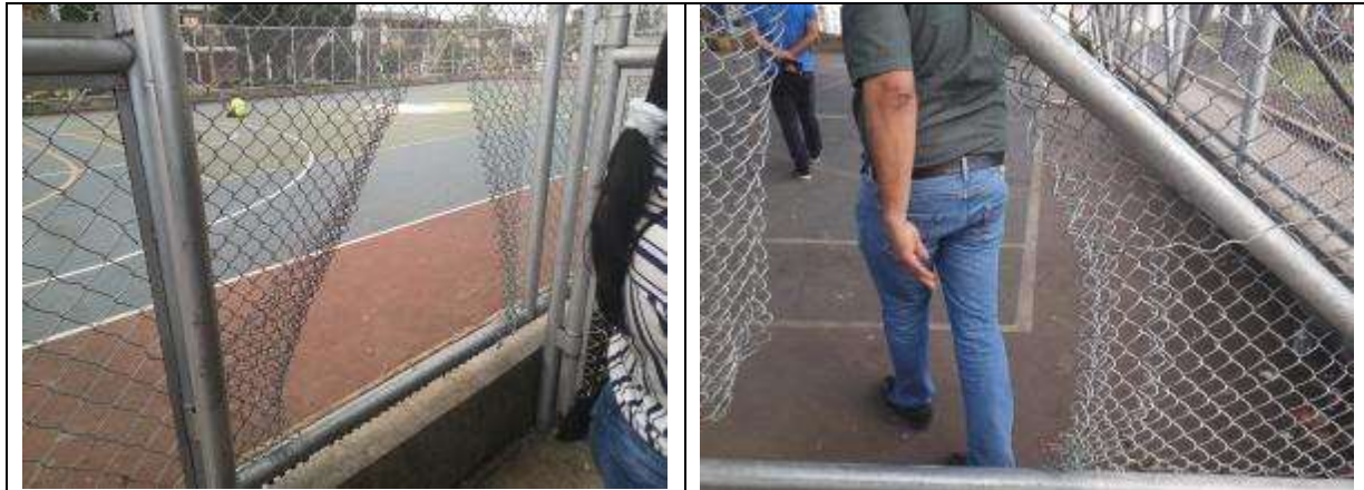
Foto 5 y 6: Daños en el cerramiento de los escenarios, la ruptura de la malla atenta contra la seguridad de los escenarios