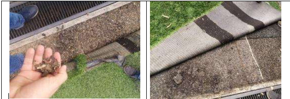
Foto No. 21 y 22 Estado del shock pad donde se evidencia el tipo de material que se puede tomar con los dedos, se deshace al tacto evidenciando que no tiene ninguna cohesión entre sus partículas.

Esta situación detectada hace que no se pueda cumplir con el objetivo del escenario deportivo, el cual es brindar un escenario para la práctica del deporte libre para la comunidad aledaña al escenario.