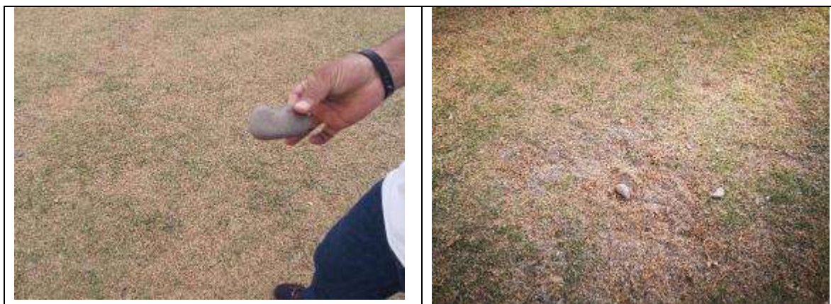
Foto No. 13 y 14: partículas de arena y grava superiores a 2mm , las cuales afloran en la grama

Esta situación detectada hace que no se pueda cumplir con el objeto del escenario deportivo, el cual es brindar un espacio para la práctica del deporte libre para la comunidad aledaña al escenario. Cabe anotar que el mismo aún no se ha puesto en servicio y que la comunidad en las visitas manifiesta su inconformismo ya que las actividades de obra se terminaron el 27 de septiembre de 2018 y a la fecha no han podido disfrutar con el aval de la Alcaldía, de este escenario.