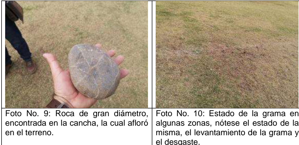
Ilustración 4. Escenario Deportivo Camilo Torres

Esta situación pone en riesgo a los jugadores pues la grama no es regular y se genera el peligro de pisar una roca o un agujero en la cancha.