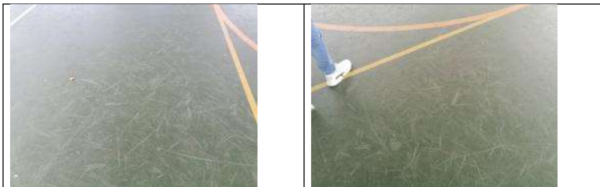
Rayones en la superficie del Plexiflor.