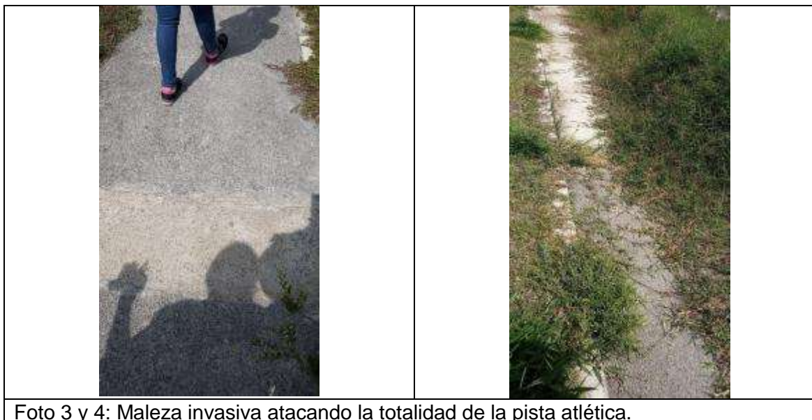
Ilustración 2. Maleza invasiva atacando la totalidad de la pista atlética

Aunada a esta situación detectada en la visita, se observó la pista atlética deteriorada y con maleza invasiva afectando la estabilidad de la obra, haciendo imposible en el estado en que se encuentra, el uso del este escenario.