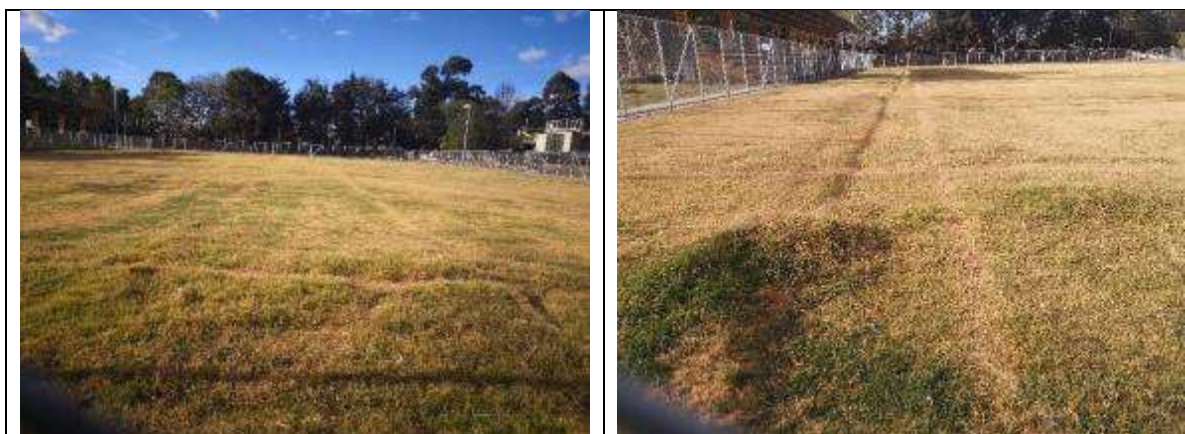
Foto No. 17 y 18: Montículos en la grama, que impiden el desarrollo normal de actividades deportivas.