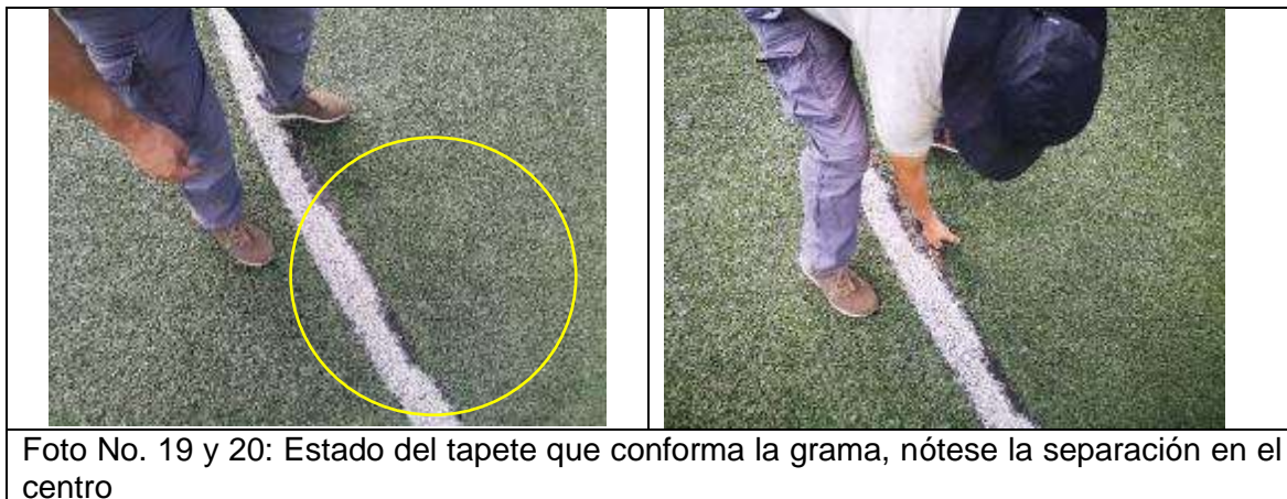
Ilustración 7. Escenario Deportivo Pandiguando.

A continuación, se presenta un registro fotográfico del estado de la cancha en el barrio.